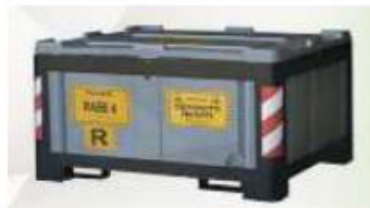
Esempi contenitori per rifiuti speciali

Tali strutture saranno affidate completamente all'Appaltatore che ne dovrà curare la gestione, mediante l'impiego del proprio personale che ne curerà la pulizia e la manutenzione e sarà l'unico l'utilizzatore dell'isola ecologica e dei contenitori di olii esausti in esse contenute.