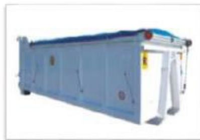
Esempi di cassoni

L'Appaltatore procederà allo svuotamento delle varie tipologie di contenitori con idonei automezzi ed idonea attrezzatura specifica per il servizio al fine di evitare imbrattamenti e sporcizie nelle aree ove questi sono collocati, pertanto verificherà che, dopo le suddette operazioni di svuotamento, l'area circostante a quella di manovra utilizzata sia pulita, non vi siano sparsi rifiuti e/o imbrattamenti da rifiuti e non vi siano sversamenti di colatici.