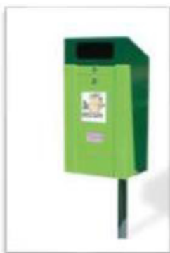
Contenitori deiezioni canine