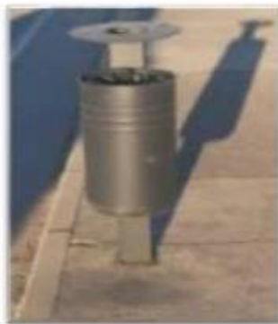
Cestini stradali installati